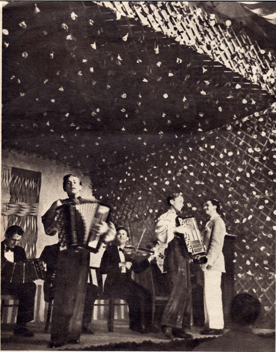
Den Dag, BILLED-BLADET besøgte Bodal, havde Plakater i Forvejen fortalt Arbejderne, at der om Aftenen skulde være Underholdning paa Gaarden. Alle, der kunde, kom til Stede. Programmet, som var opslaaet paa Mosekontoret, fortalte om Optræden af københavnske Kabaretkunstnere. Adgangen til Underholdningen er gratis for Arbejdere med Paarørende.